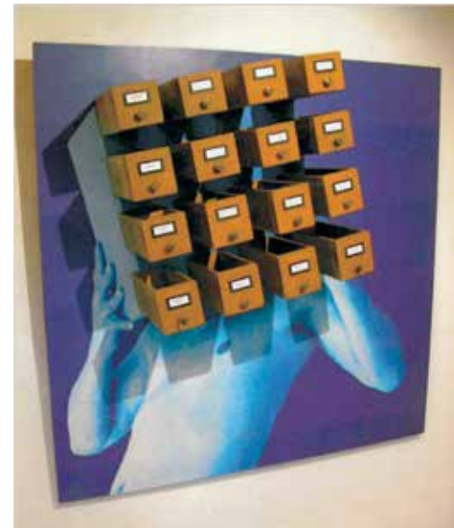
Alte Kisten 2005 Fotoinstallation