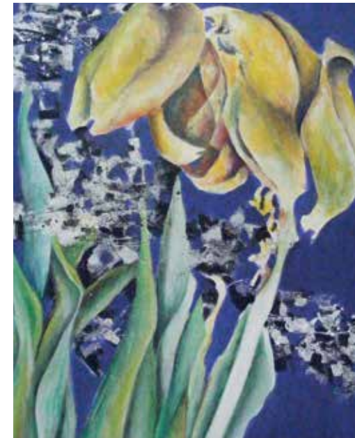
Gelbe Tulpen 2008 Acryl auf Leinwand 60 x 50 x 7,5 cm (Serie: Kompos(t)itionen)

Verwaltungsgemeinschaft Gemünden/Main, Reha-Klinik Bad Neustadt/Saale