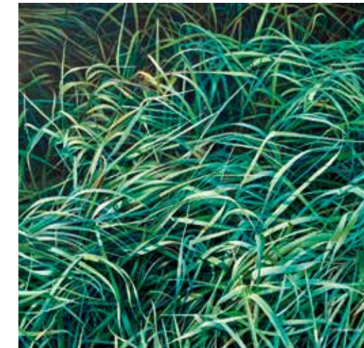
Gräser I 2013/14 80 x 80 cm

weitere Ausstellungen in Quistreham, der Partnerstadt von Lohr, Fulda, Gelnhausen, Aschaffenburg, Mellrichstadt.